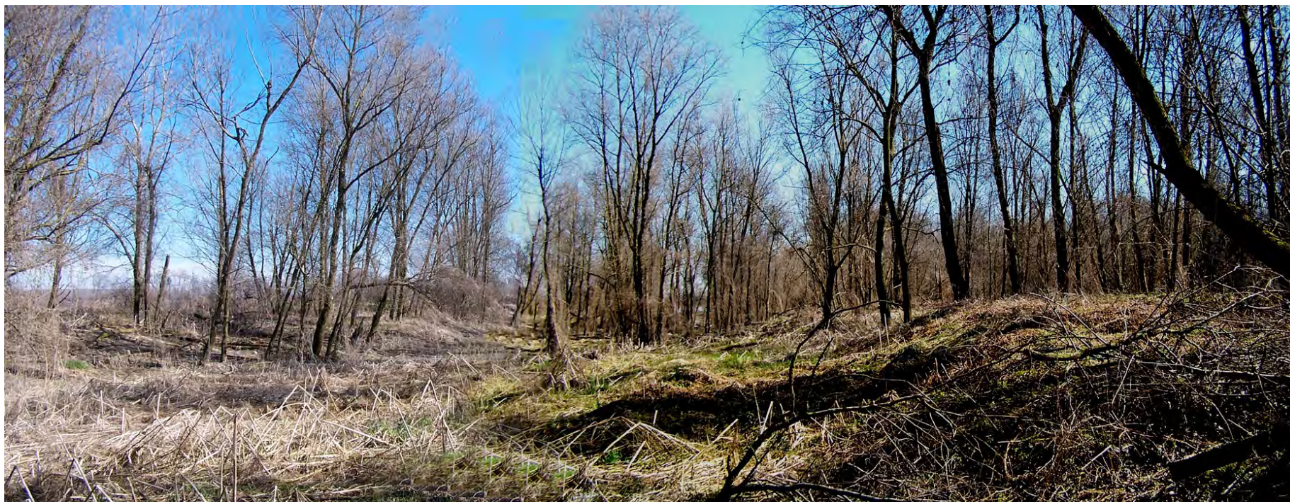
Ripresa n° 34 – l'habitat 91E0 al suo interno