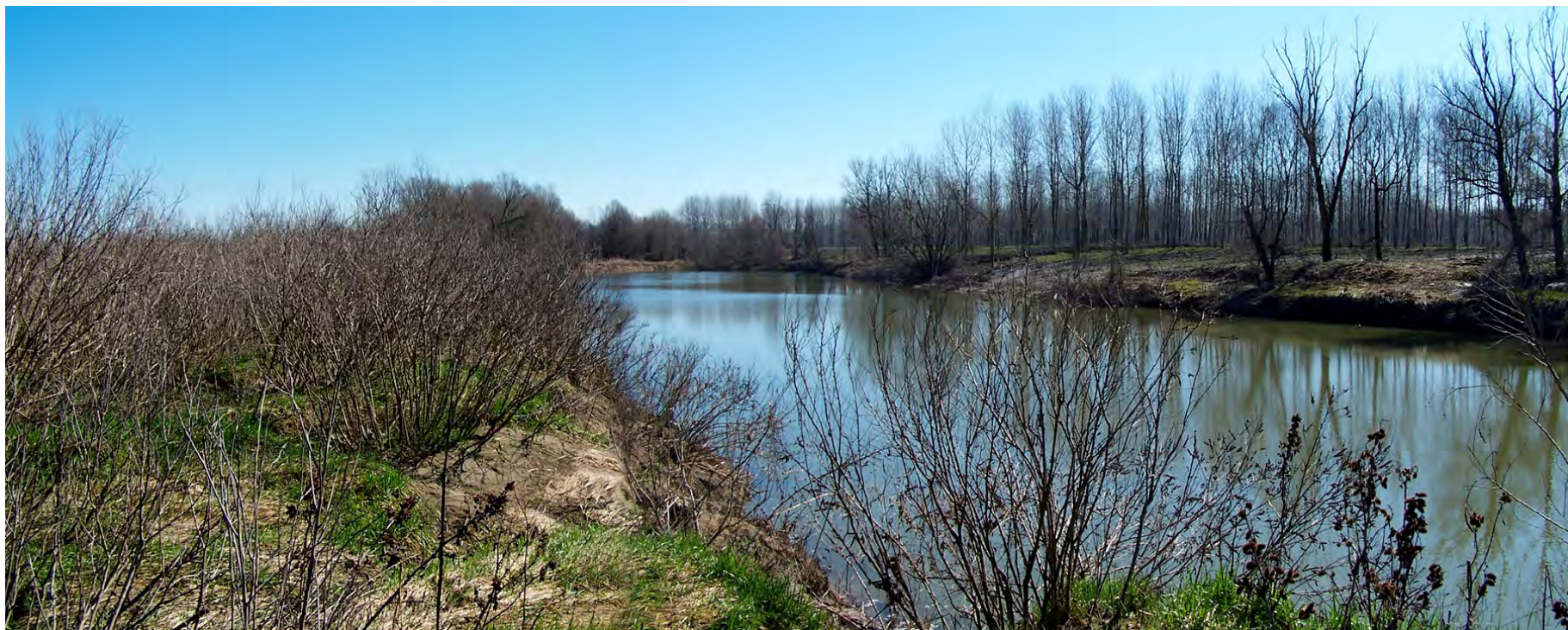
Ripresa n° 31 – Il tratto terminale della lanca del pennello.