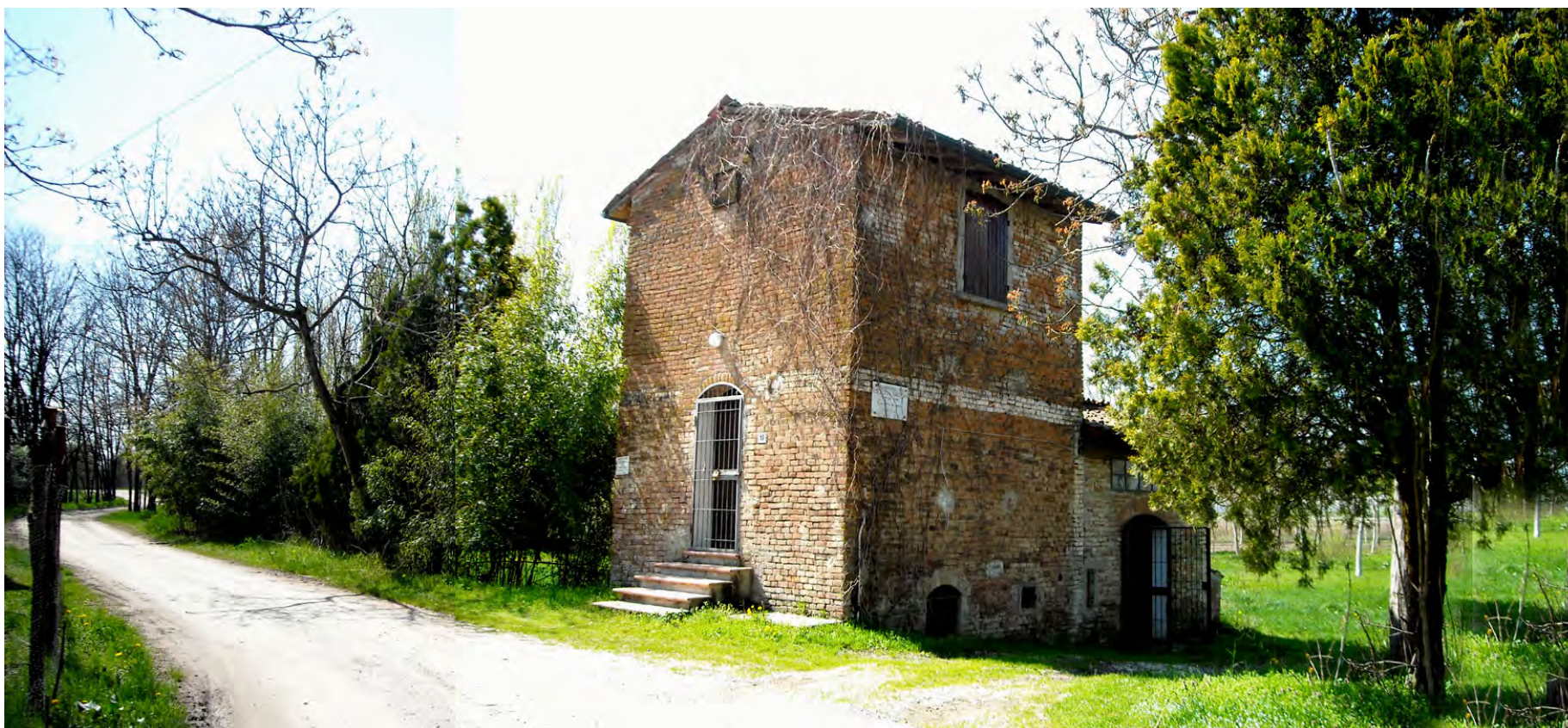
Ripresa n° 38 – Il fabbricato esistente in prossimità della ZPS, oggi a servizio del centro di AMA Onoterapia.