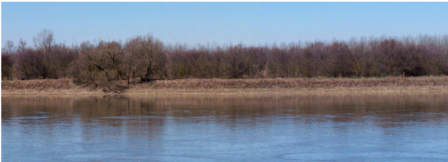
Ripresa n° 25 – L'impianto forestale sull'isola visto dalla sponda opposta