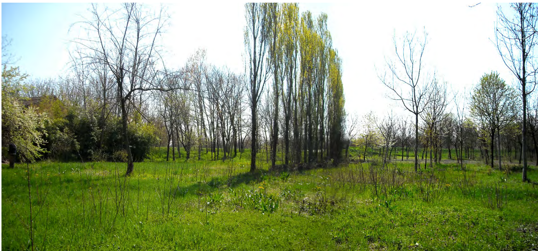
Ripresa n° 39 – interventi di diversificazione ambientale eseguiti nella golena protetta, appena fuori della ZPS.