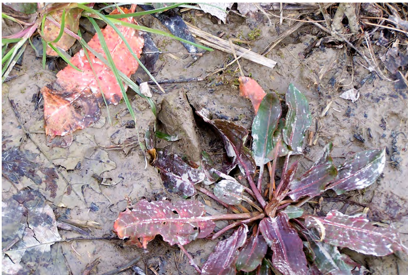
Ripresa n° 20 – impronta di capriolo ( Capreolus capreolus ) sull'isola