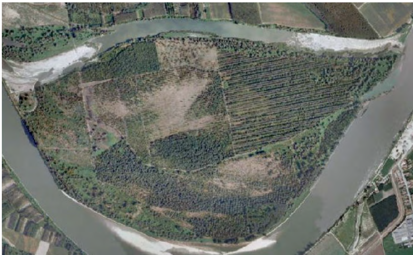
Ortofoto 2008