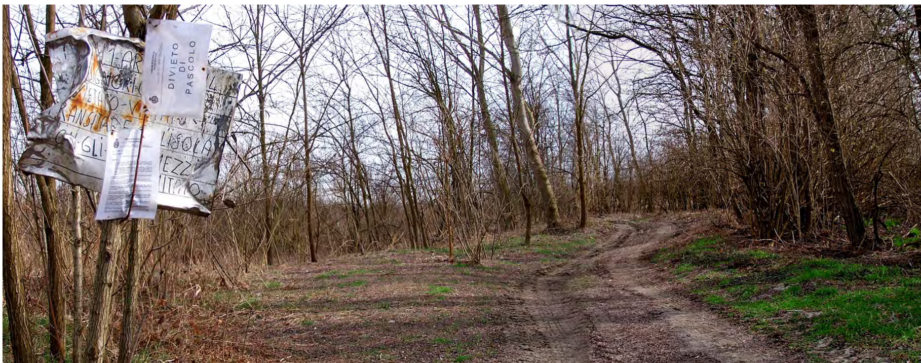
Ripresa n° 1 – l'accesso all'isola con i cartelli di divieto di pascolo e di transito con mezzi motorizzati (ATC)