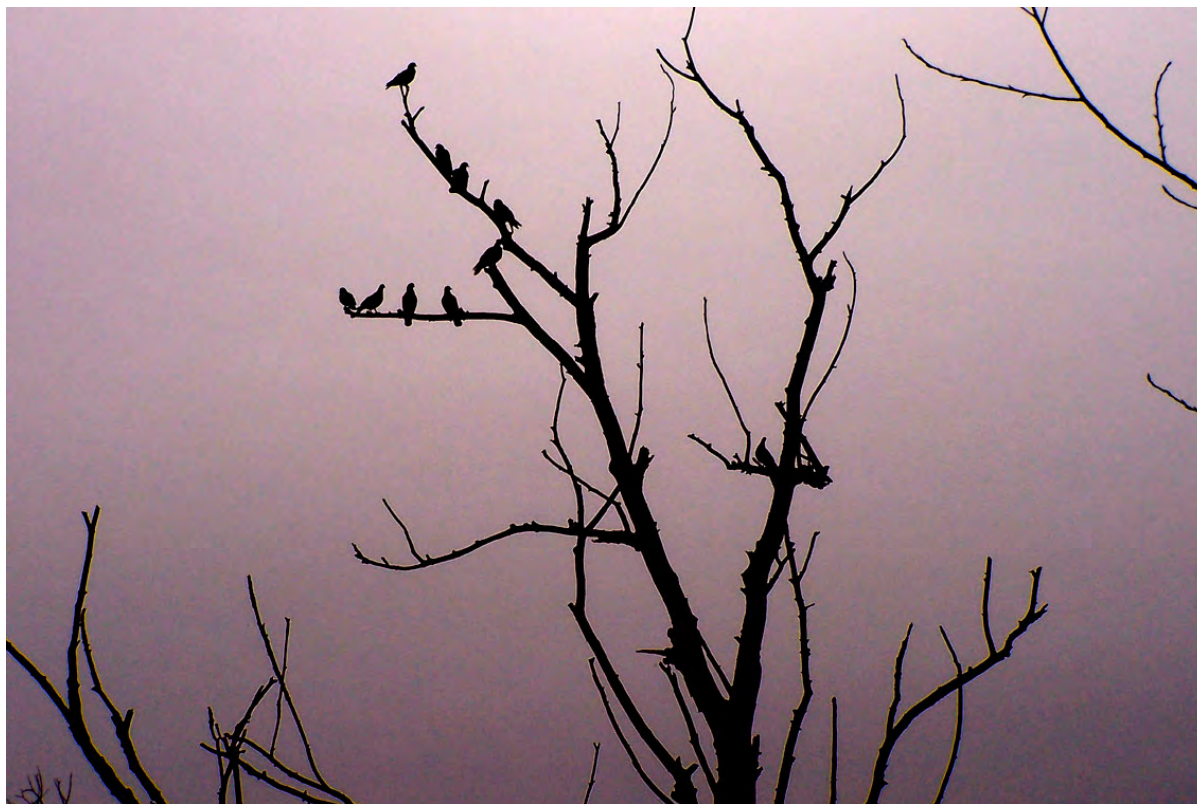
Ripresa n° 18 – Colombacci su un salice ormai morto