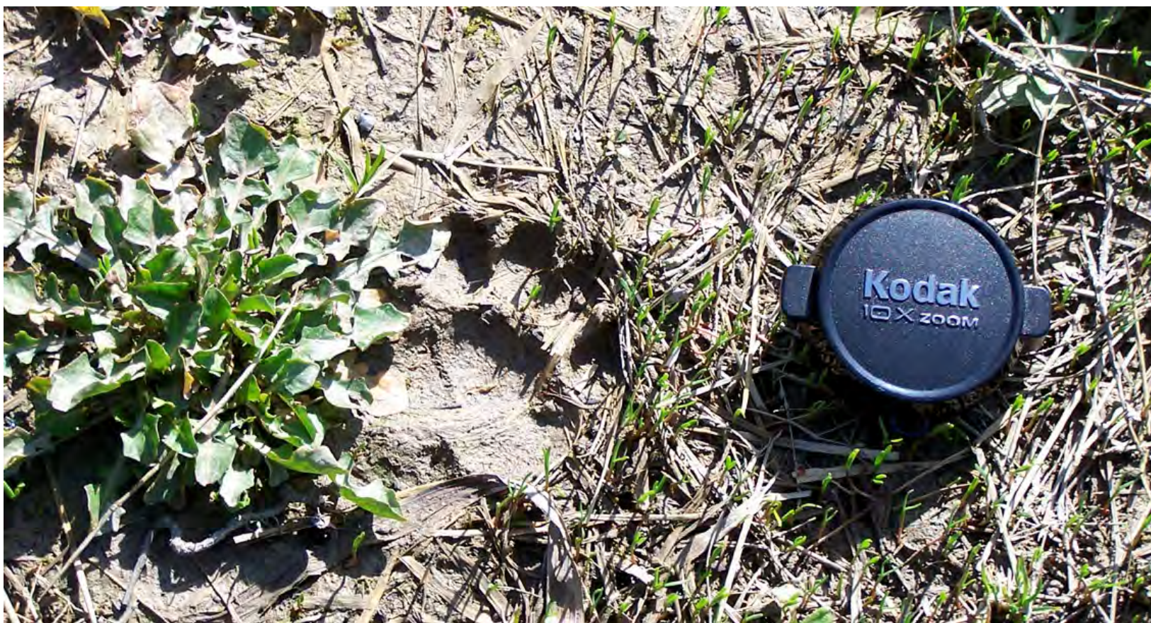
Ripresa n° 22 – probabile impronta di tasso ( Meles meles ) sull'isola