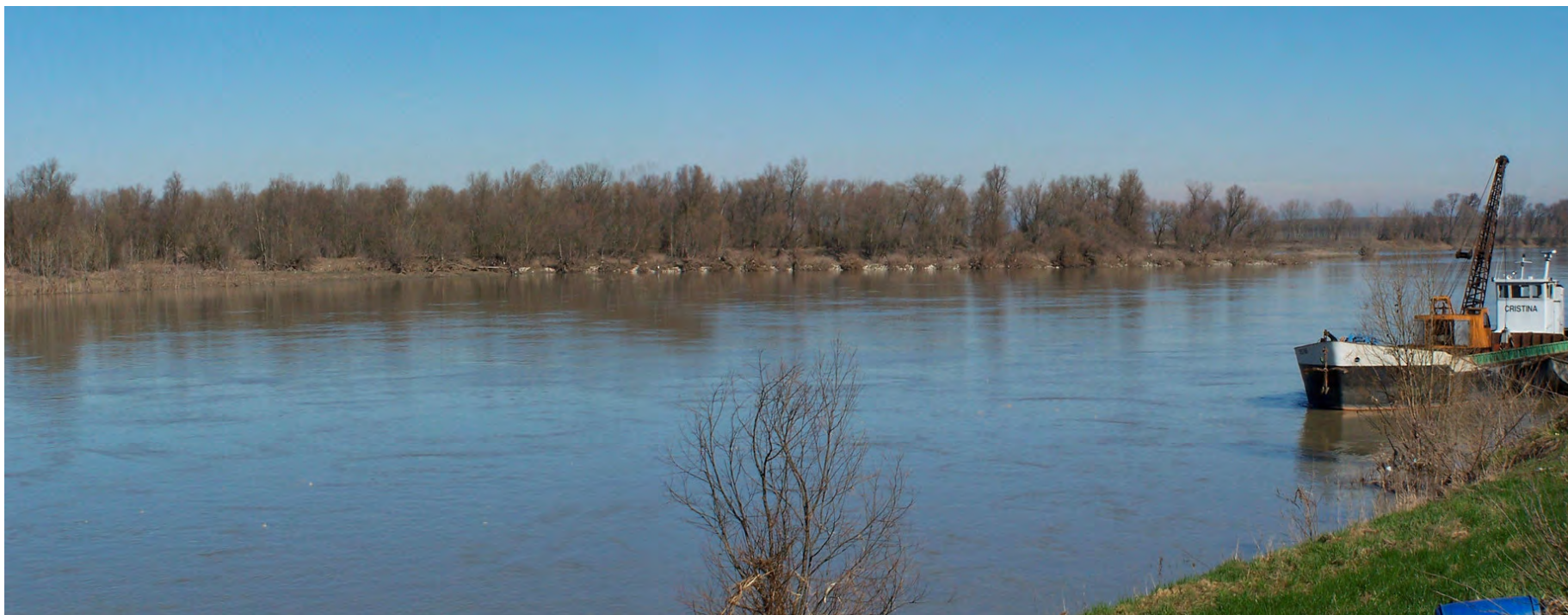
Ripresa n° 24 – la parte terminale est dell'habitat 91E0 sull'isola