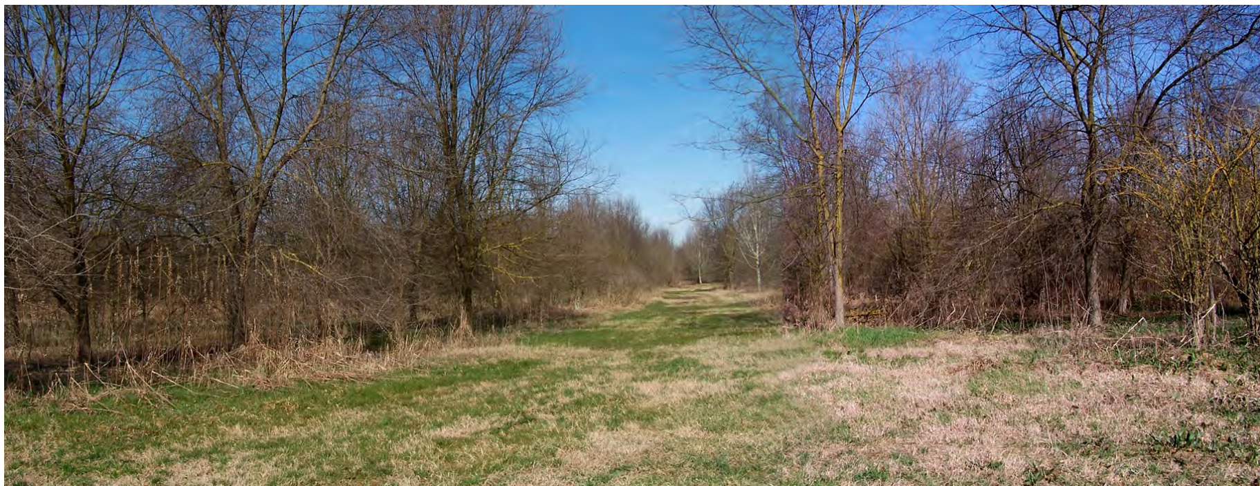
Ripresa n° 3 - Uno scorcio dell'impianto forestale del 1998 sull'isola