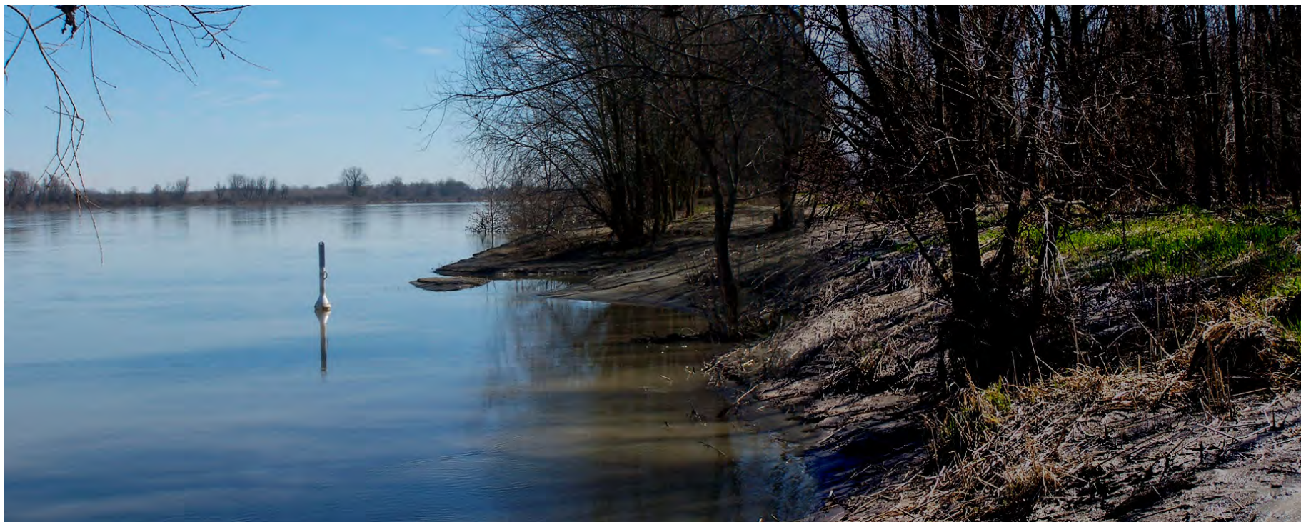
Ripresa n° 36 – La riva del Po, sullo sfondo l'isola Maria Luigia, riconoscibile dal pioppo nero monumentale all'attaccatura del pennello.