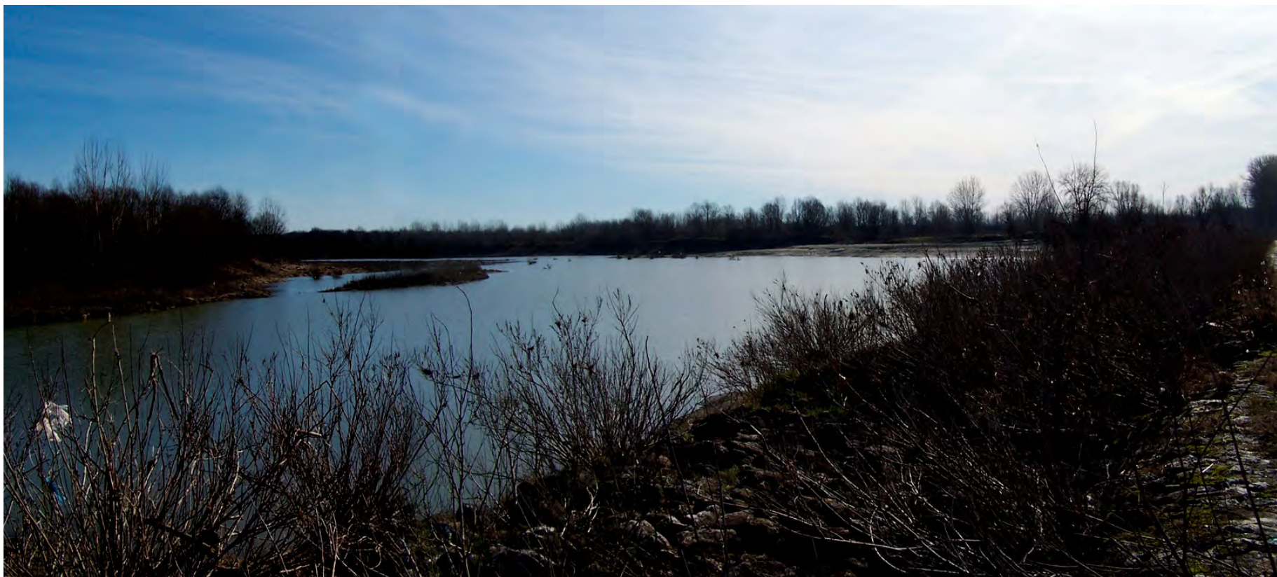
Ripresa n° 8 – La lanca del pennello sullo sfondo l'area dell'habitat 3270