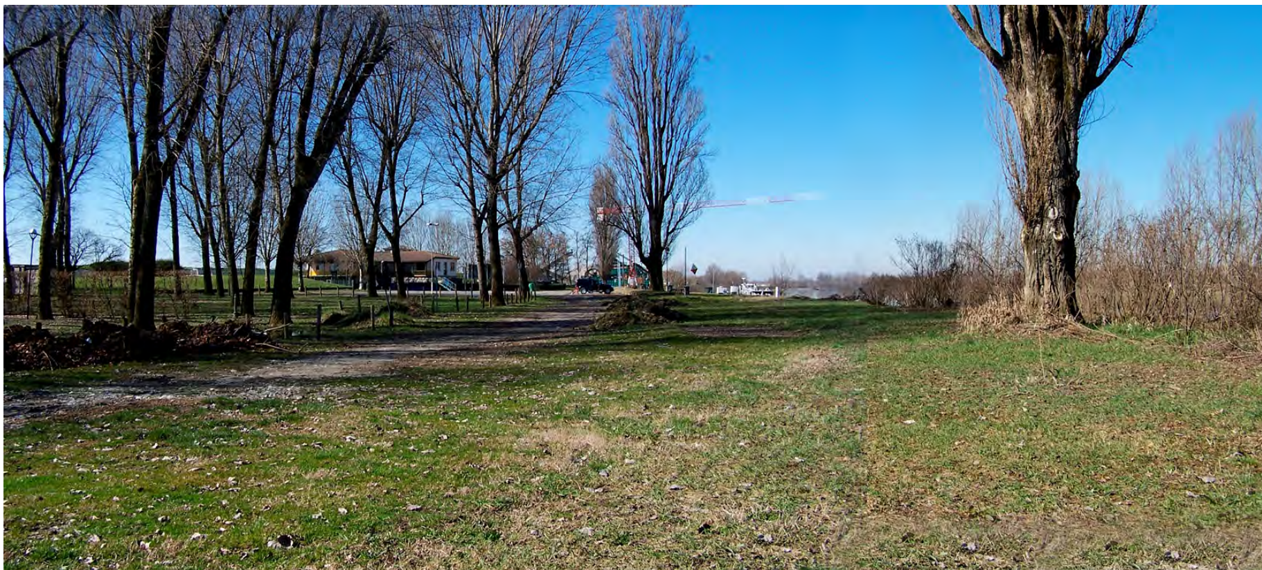
Ripresa n° 37 – La pizzeria lo Storione e la zona attrezzata antistante, al limite ovest della ZPS, già in provincia di Parma (Coltaro)