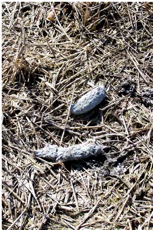
Ripresa n° 21 – Marcatura di Volpe sull'isola