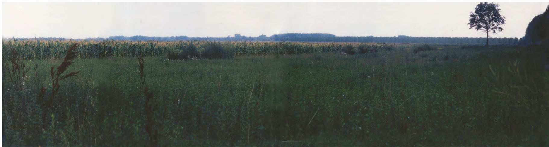
1997 - la parte sud ovest dell'isola occupata da seminativi di mais