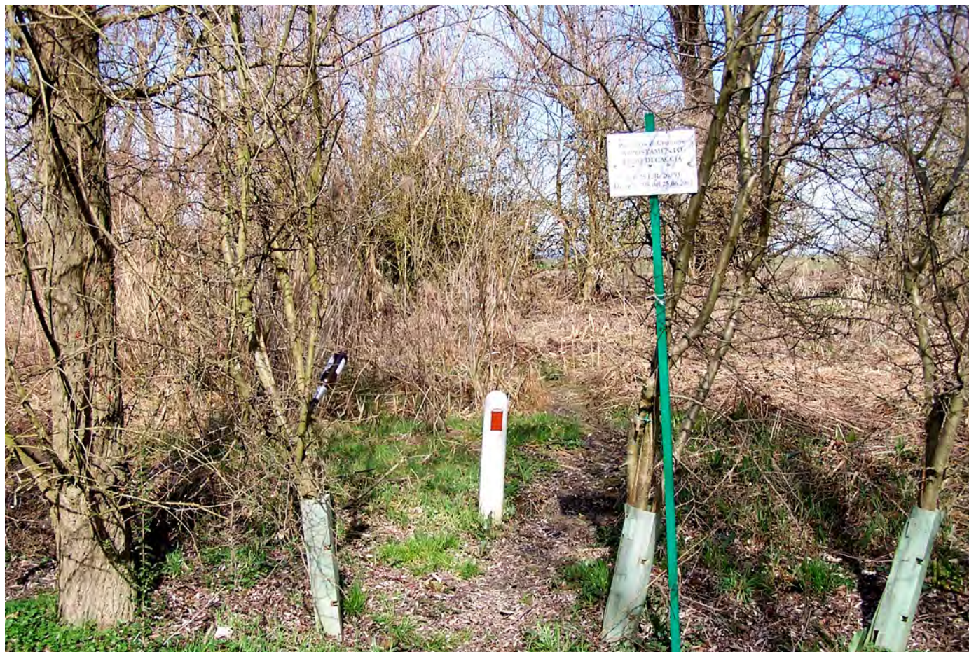
Ripresa n° 17 – l'accesso all'appostamento fisso di caccia sull'isola