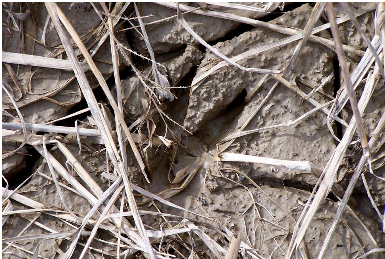
Ripresa n° 19 - impronta di capriolo ( Capreolus capreolus ) sul fango della riva