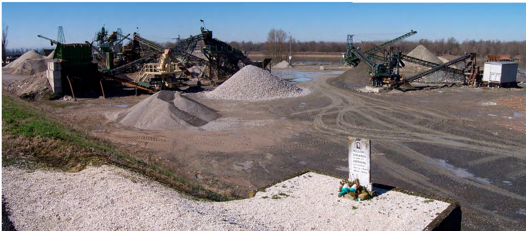
Ripresa n° 27 – Il centro lavorazione inerti e una lapide commemorativa davanti all'isola, in provincia di Parma (Colorno)