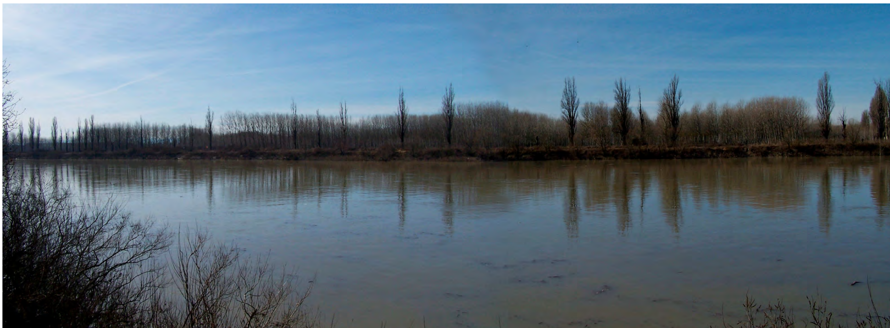
Ripresa n° 6 – Il Po e la sponda opposta vista dall'isola con i resti del vecchio filare di pioppi cipressini