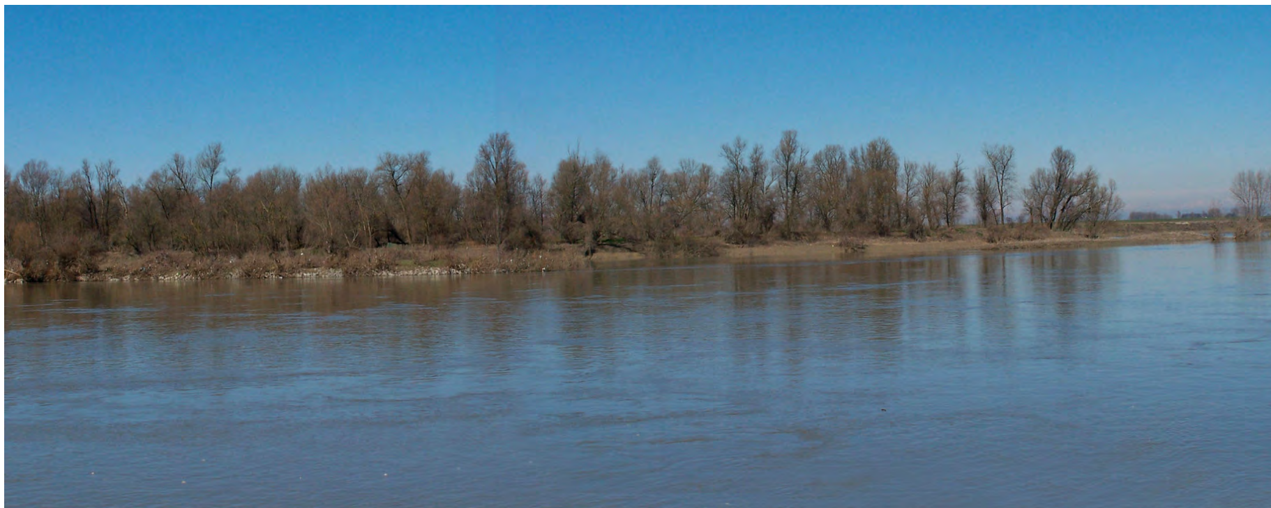
Ripresa n° 28 – L'habitat 91E0 nella parte terminale dell'isola Maria Luigia