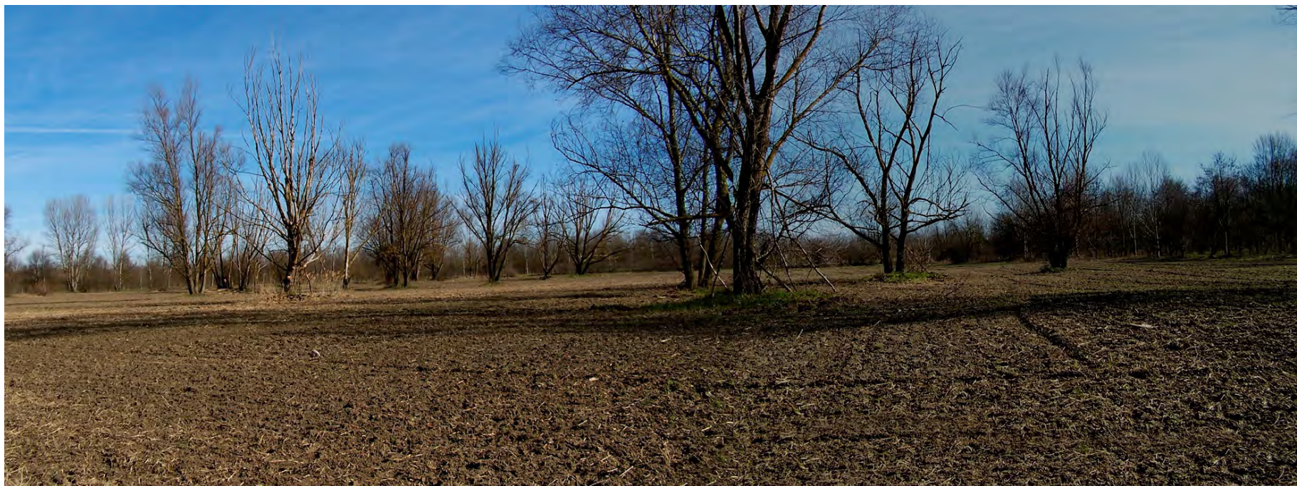
Ripresa n° 5 – Ampia radura con Salice bianco sull'isola