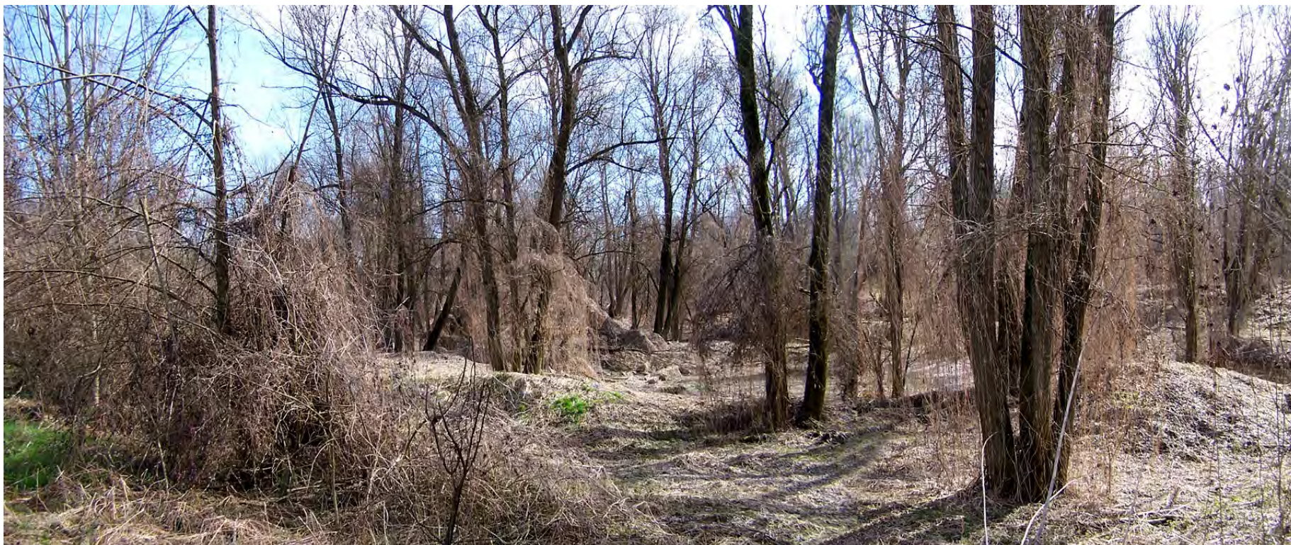
Ripresa n° 2 – L'habitat 91E0