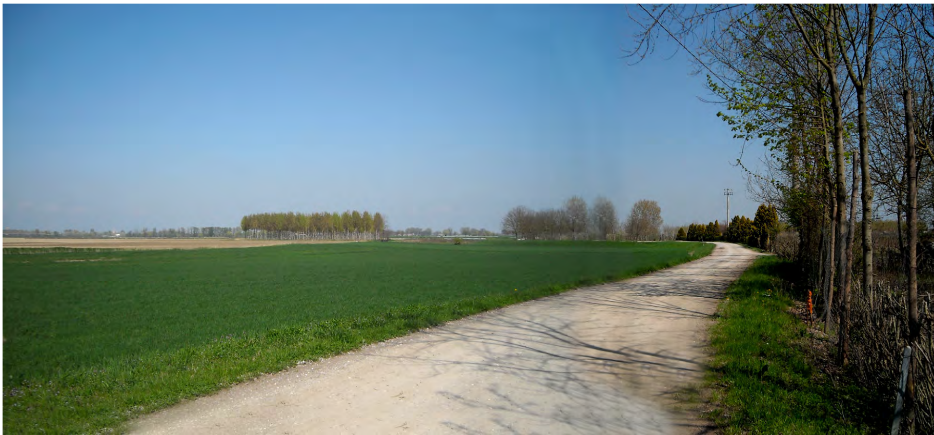
Ripresa n° 41 – La strada di accesso alla ZPS nel suo tratto terminale, prima dell'argine comprensoriale