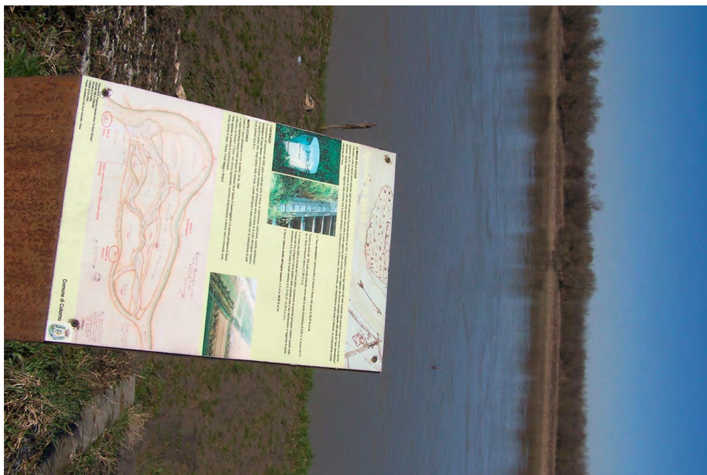
Ripresa n° 26 – l'area comunale di Colorno PR antistante l'isola e un pannello didattico