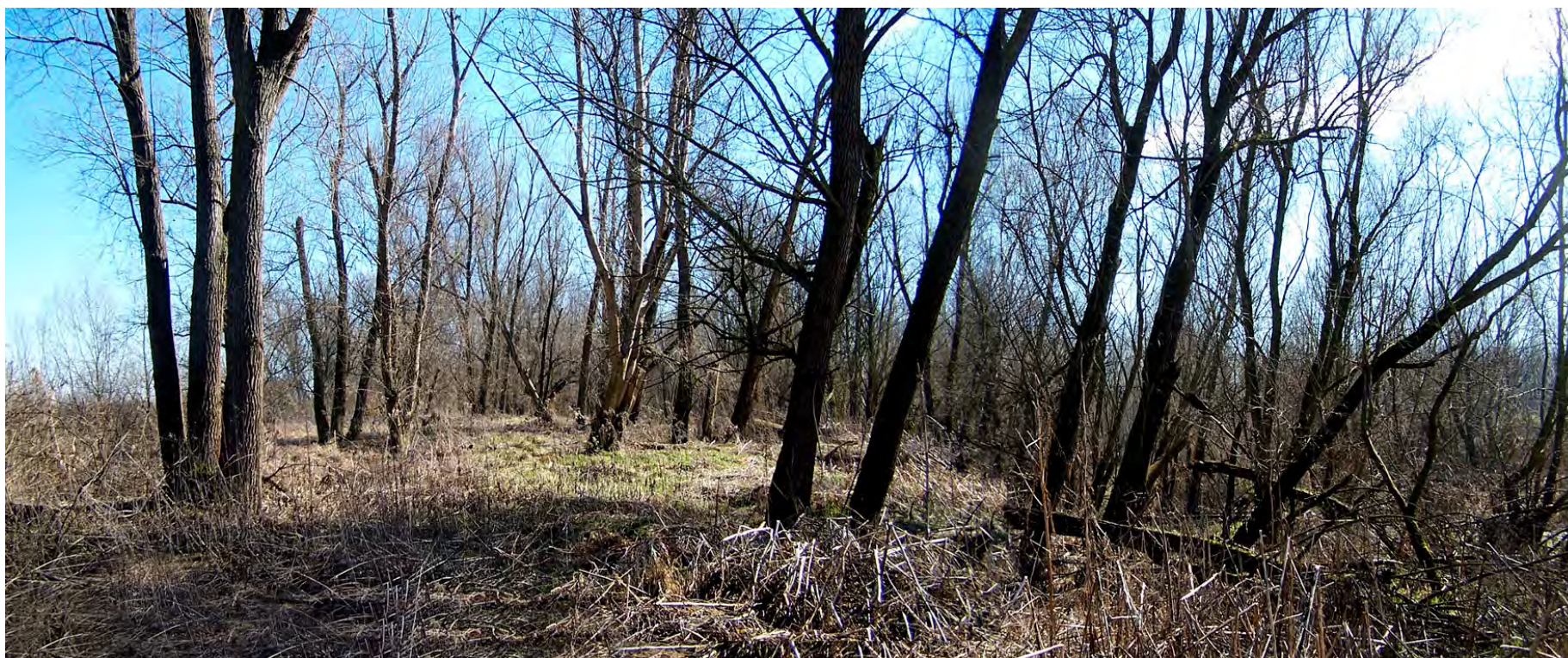
Ripresa n° 32 – il tratto iniziale dell'habitat 91E0 sul pennello di difesa idraulica.