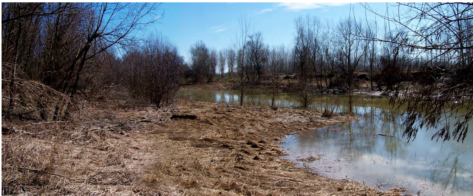
Ripresa n° 33 – Habitat 91E0 al bordo della lanca interna.