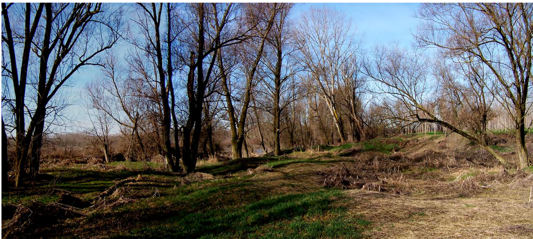
Ripresa n° 13 – l'habitat 91E0 nella gola nord