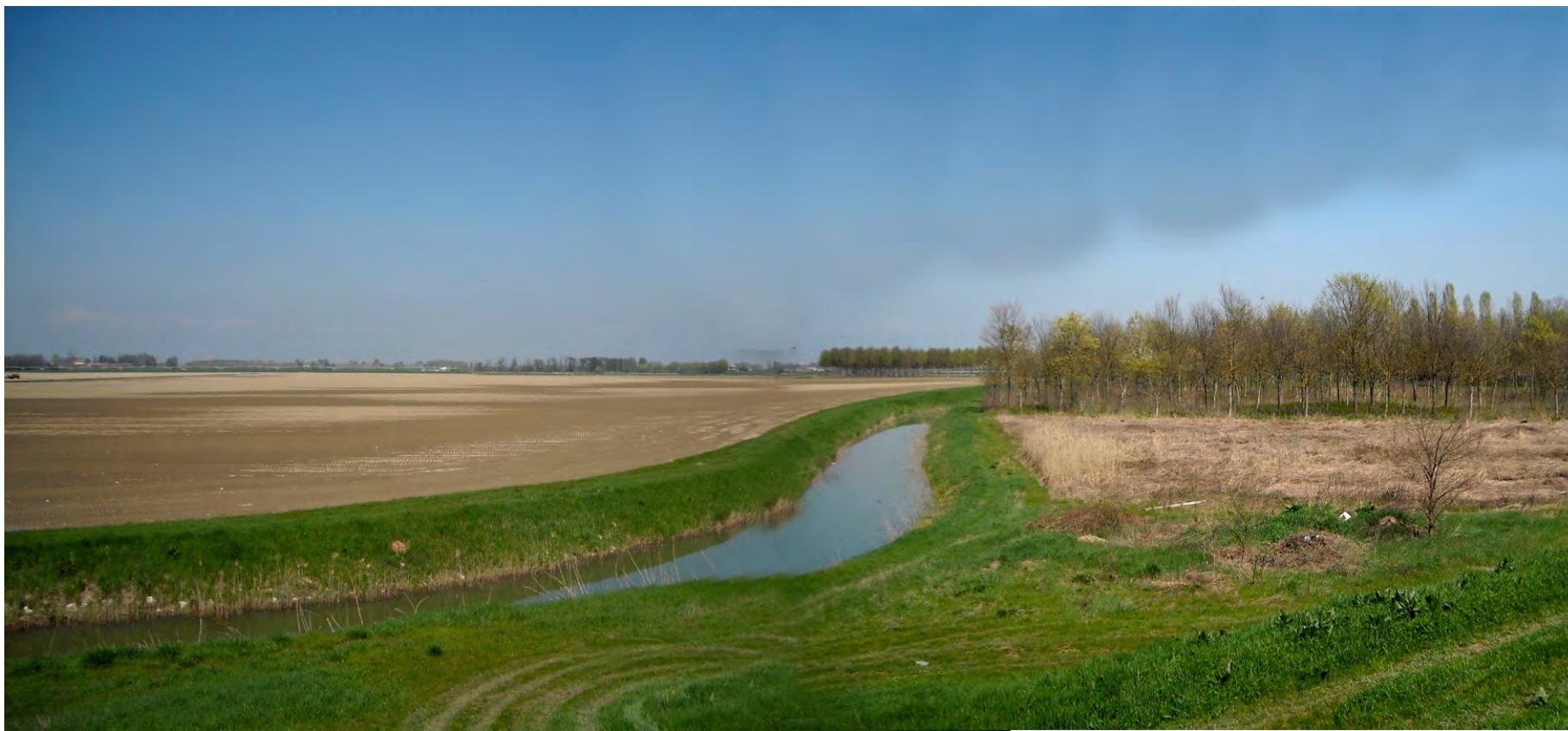
Ripresa n° 40 – Il Riolo, corridoio della rete ecologica del PTCP, privo di qualunque elemento di connessione ecologica.