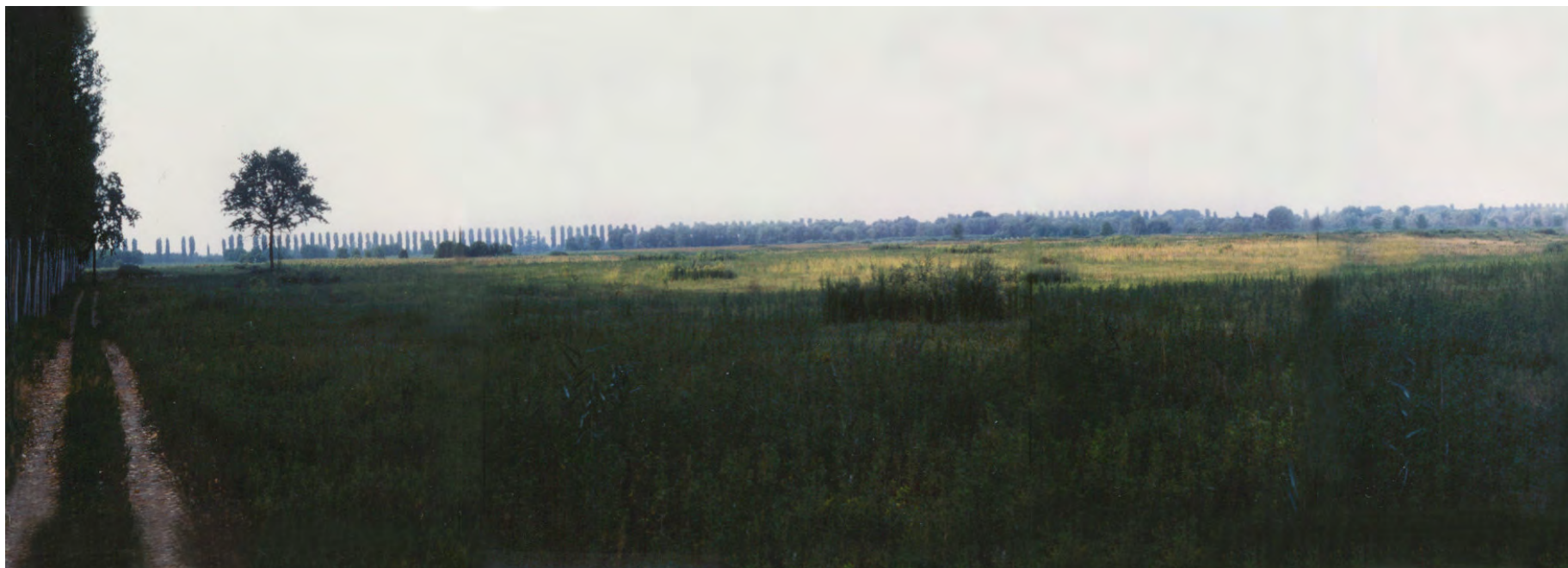
1997 – la parte nord ovest dell'isola due anni dopo il taglio del pioppeto