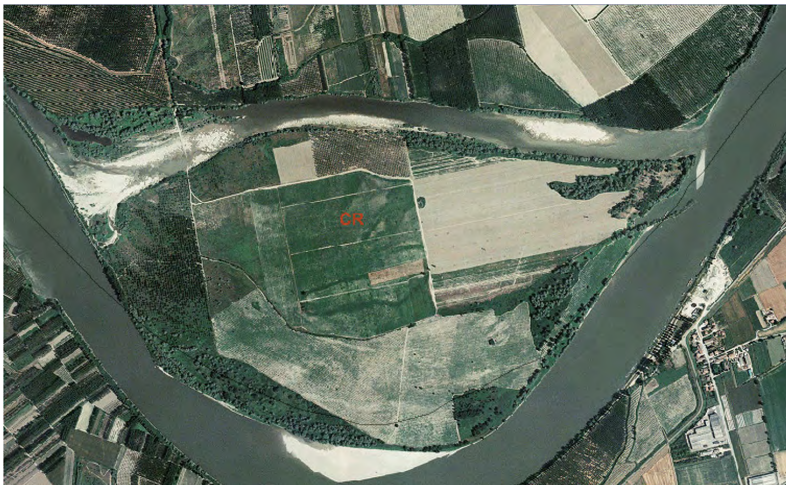
Ortofoto 1998