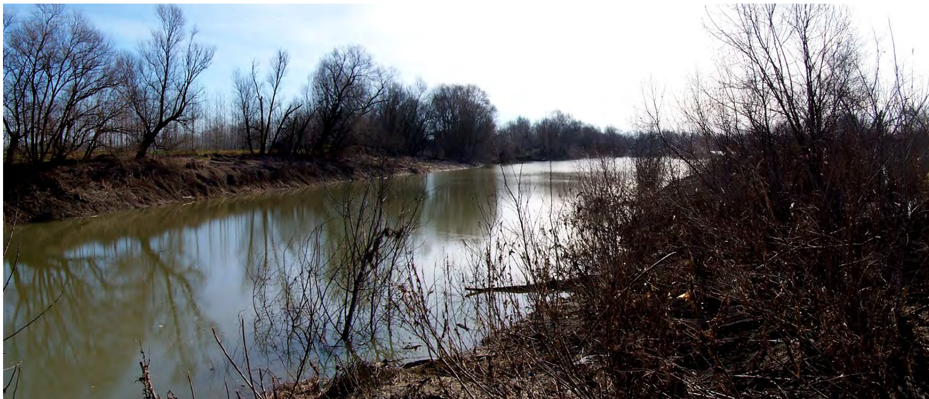
Ripresa n° 10 – La lanca del pennello