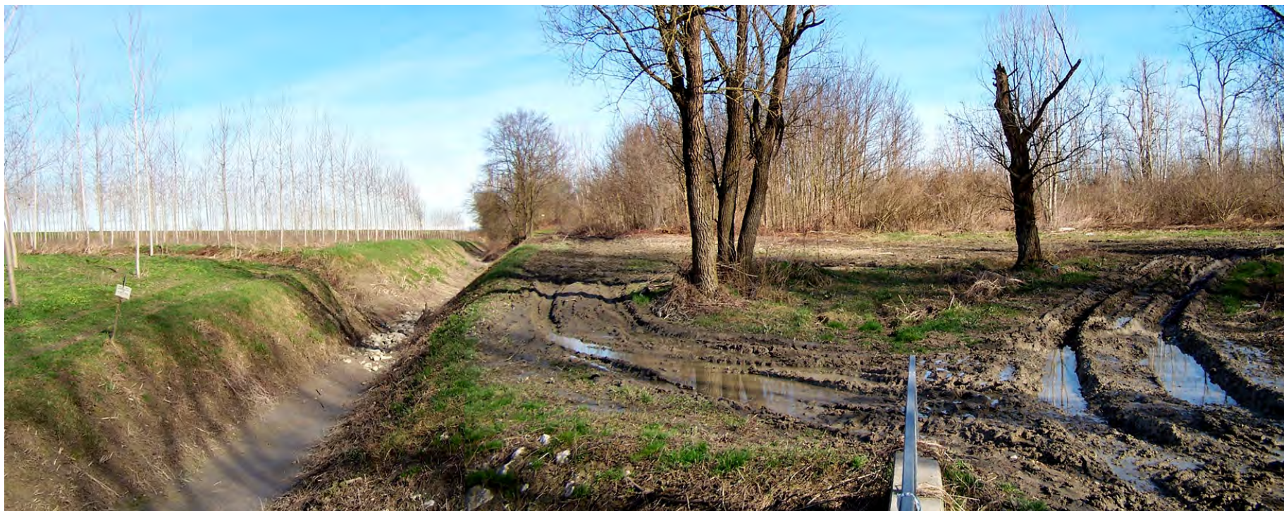
Ripresa n° 14 – il tratto terminale del Riolo in inverno, totalmente privo di acqua.