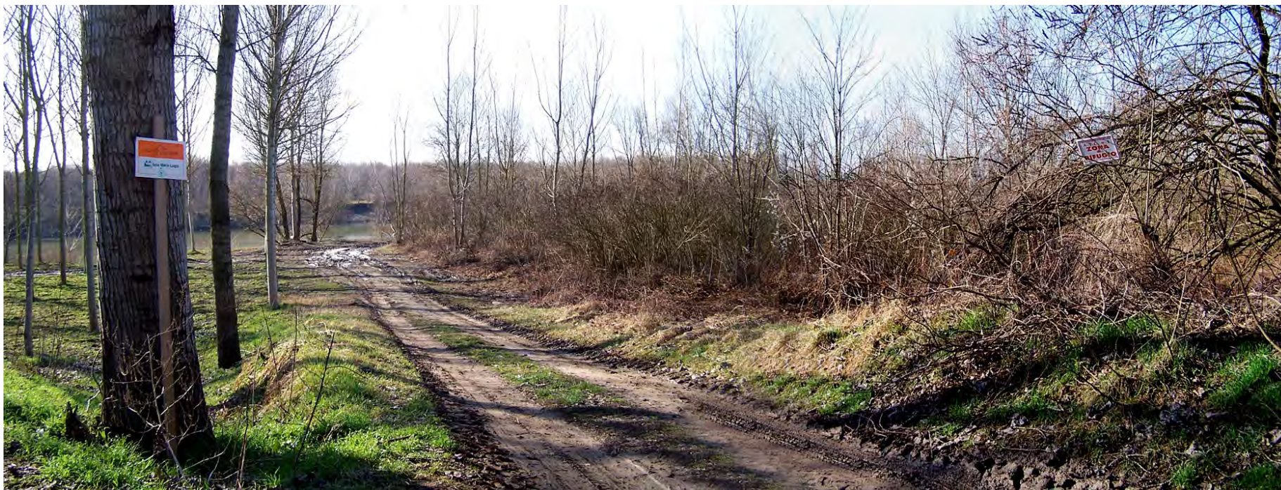
Ripresa n° 16 – Accesso alla ZPS dall'argine comprensoriale