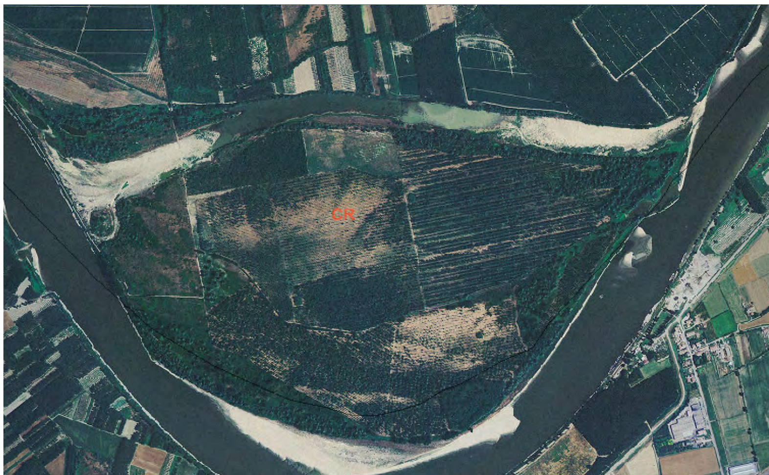
Ortofoto 2007