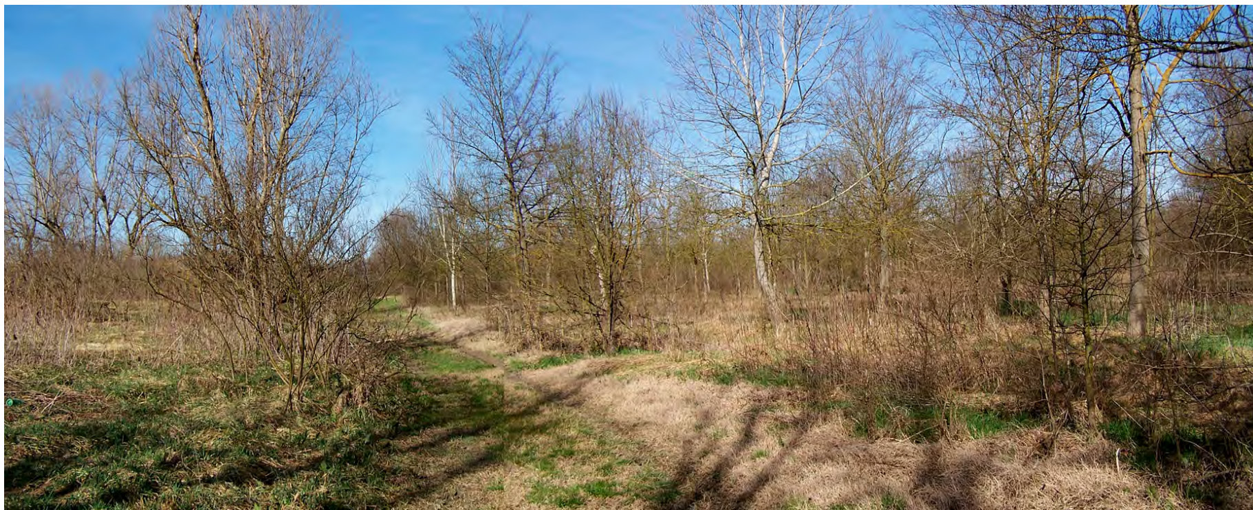
Ripresa n° 4 – Uno scorcio dell'impianto forestale del 2000 sull'isola