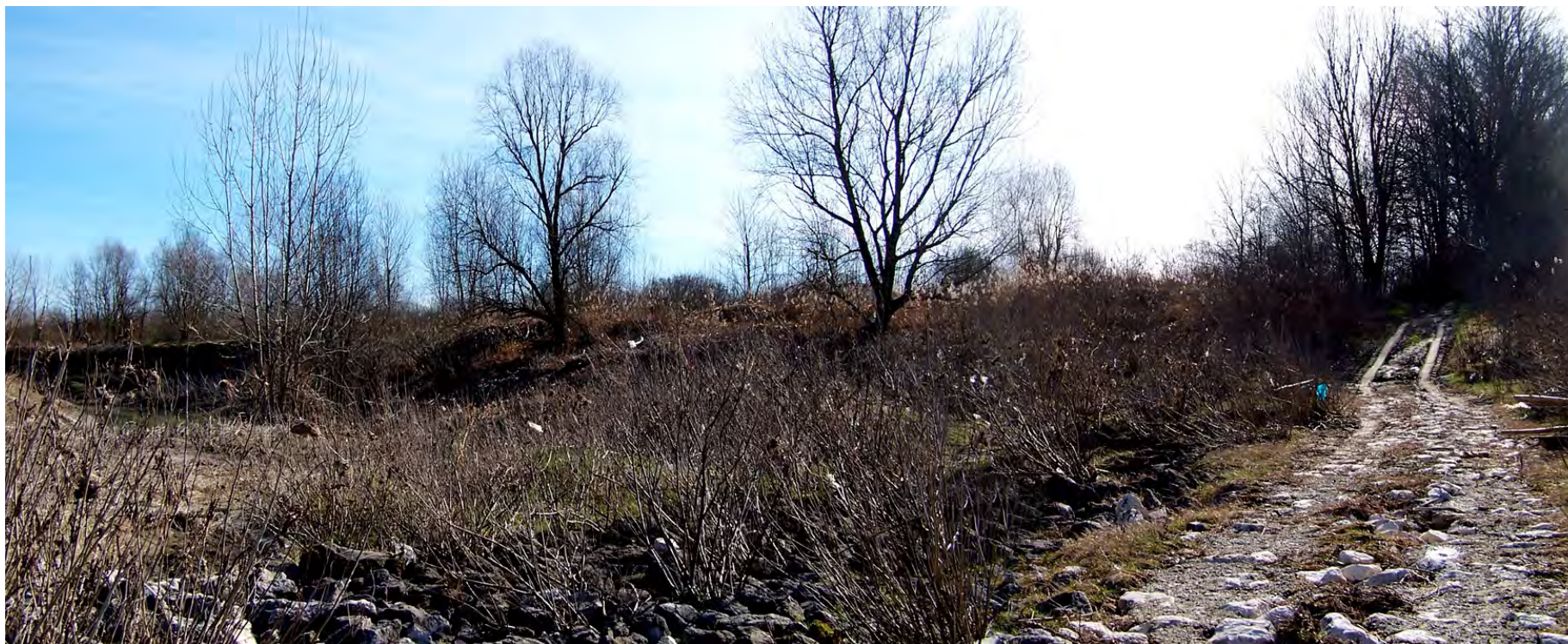
Ripresa n° 7 – l'accesso all'isola al termine del pennello