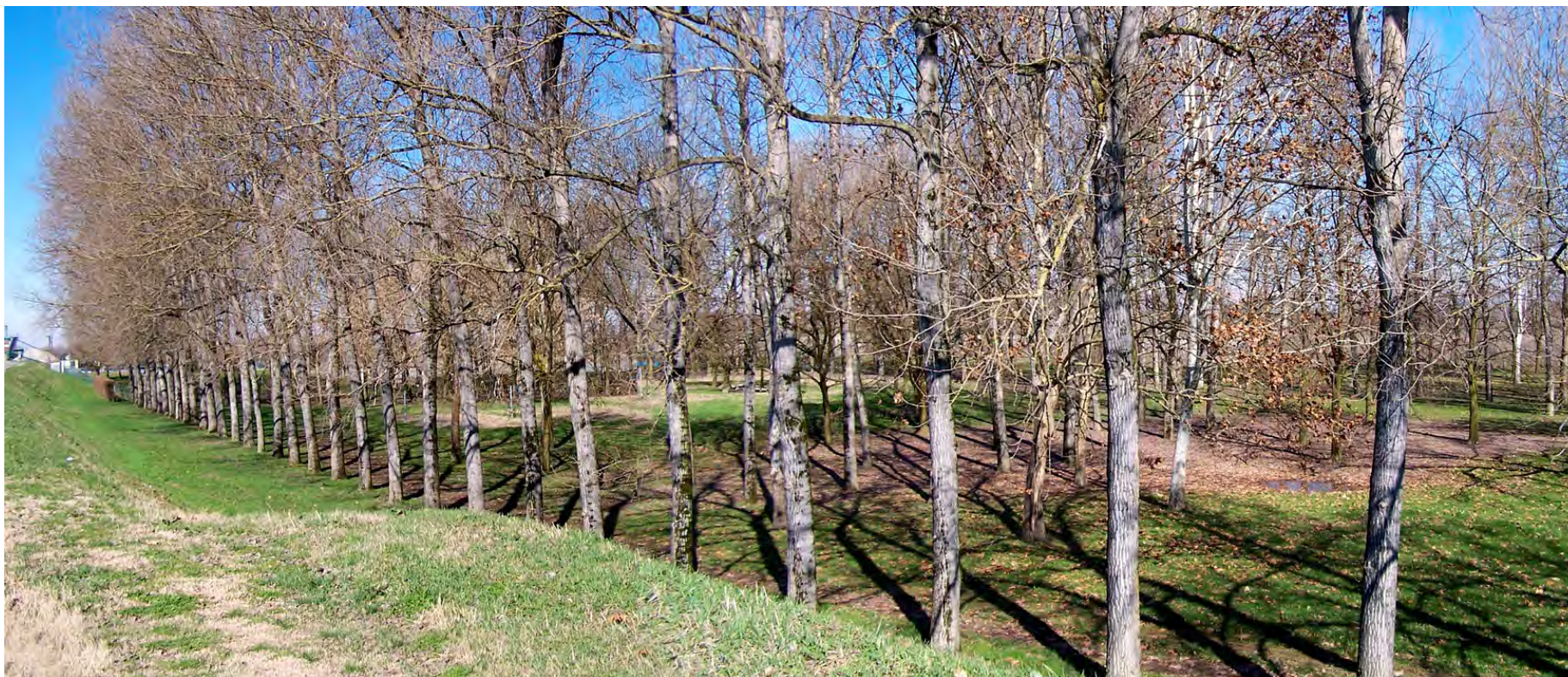
Ripresa n° 29 – Alberature della golena nell'area attrezzata al limite ovest della ZPS in provincia di Parma (Coltaro).