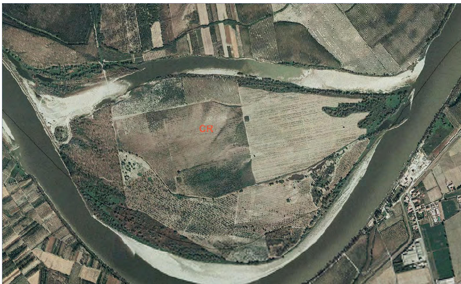
Ortofoto 2003