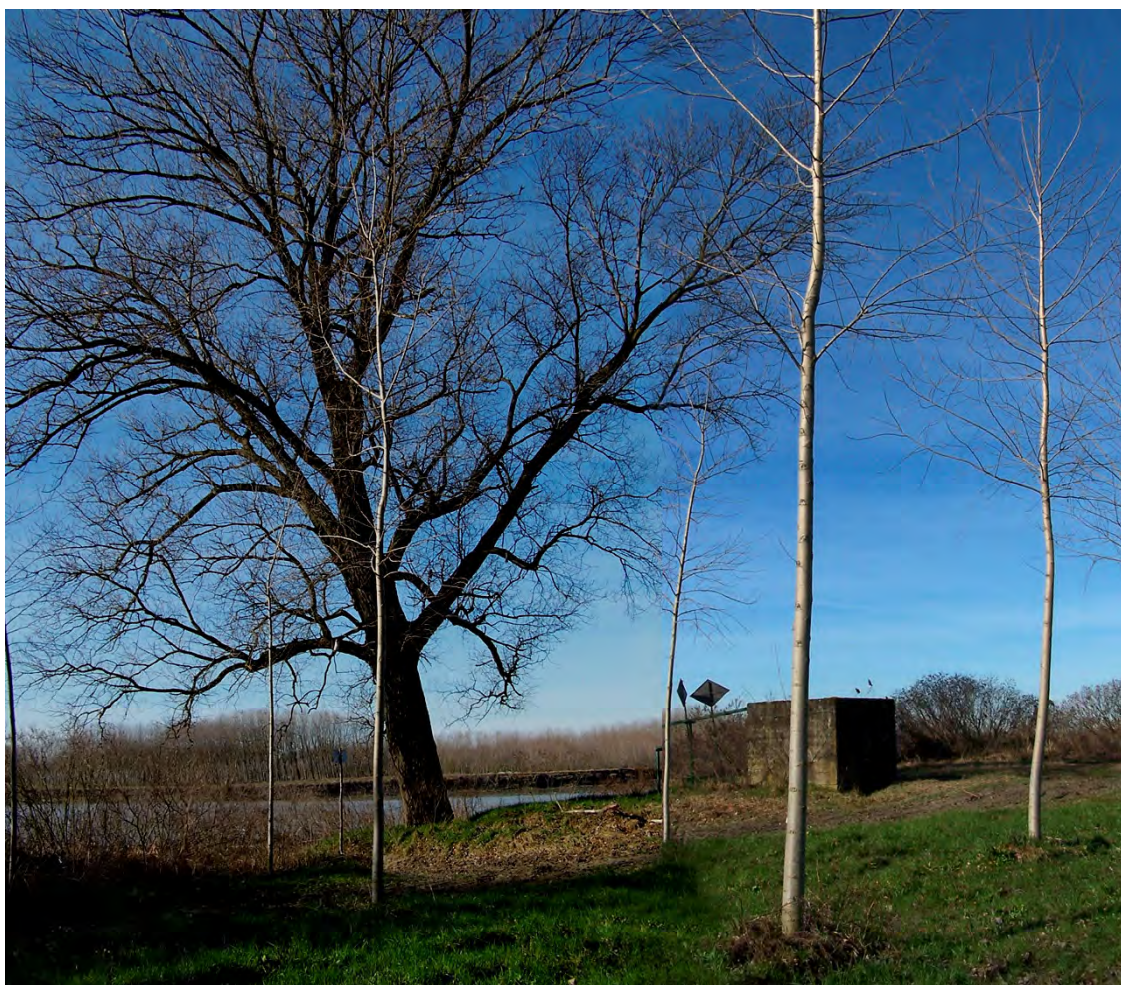
Ripresa n° 12 – il pioppo nero monumentale che segna l'accesso al pennello