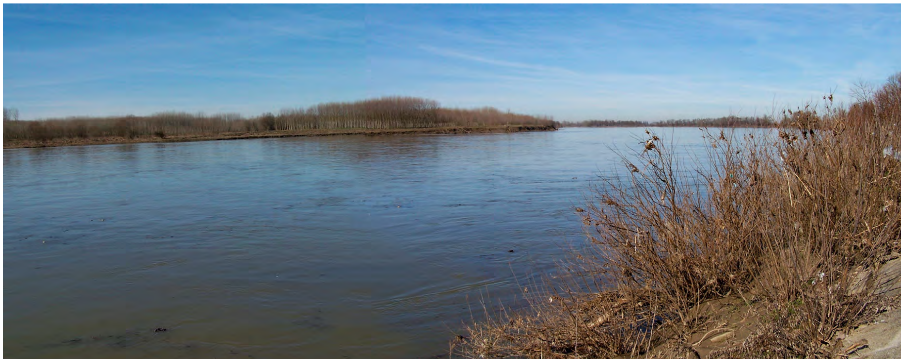
Ripresa n° 9 – Il Po visto dal pennello nel suo tratto interno alla ZPS