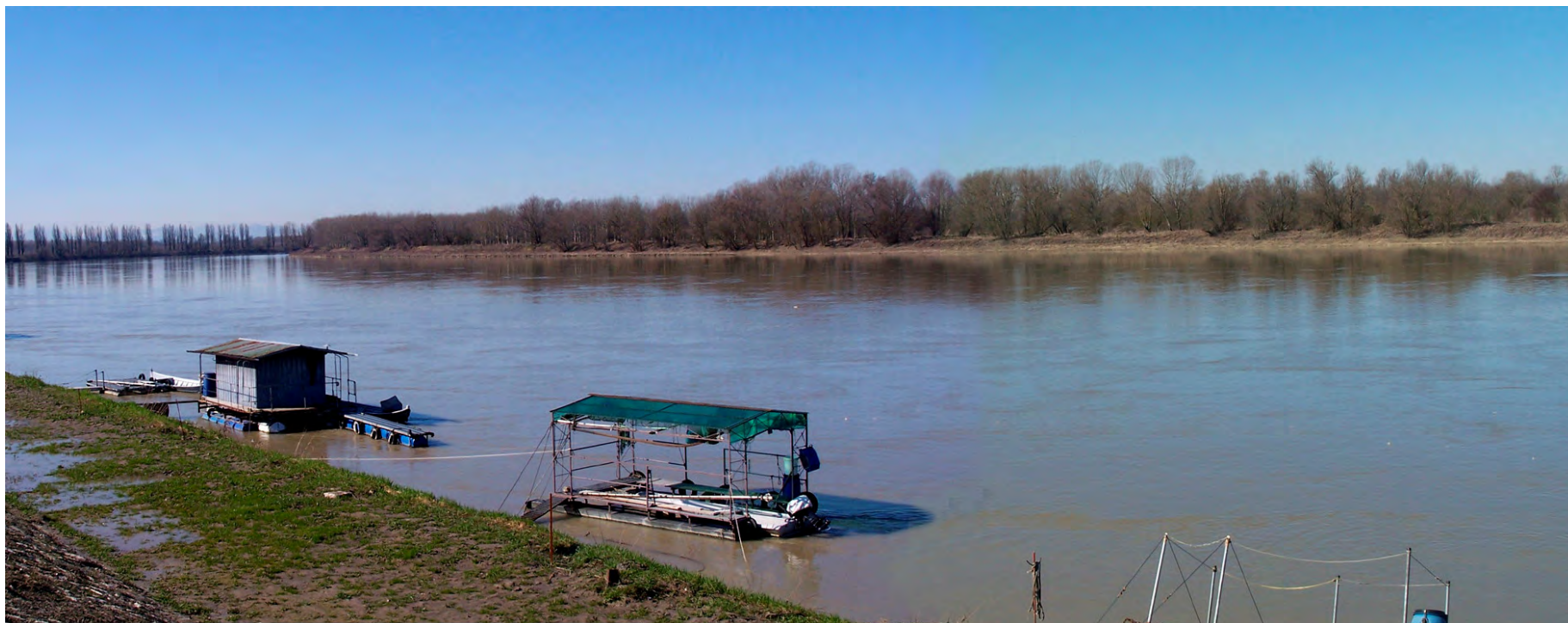
Ripresa n° 23 – Habitat 91E0 integrato con l'impianto forestale