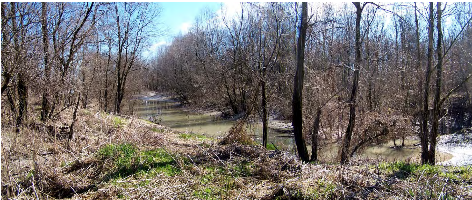
Ripresa n° 35 – l'habitat 91E0 in sponda destra del fiume.