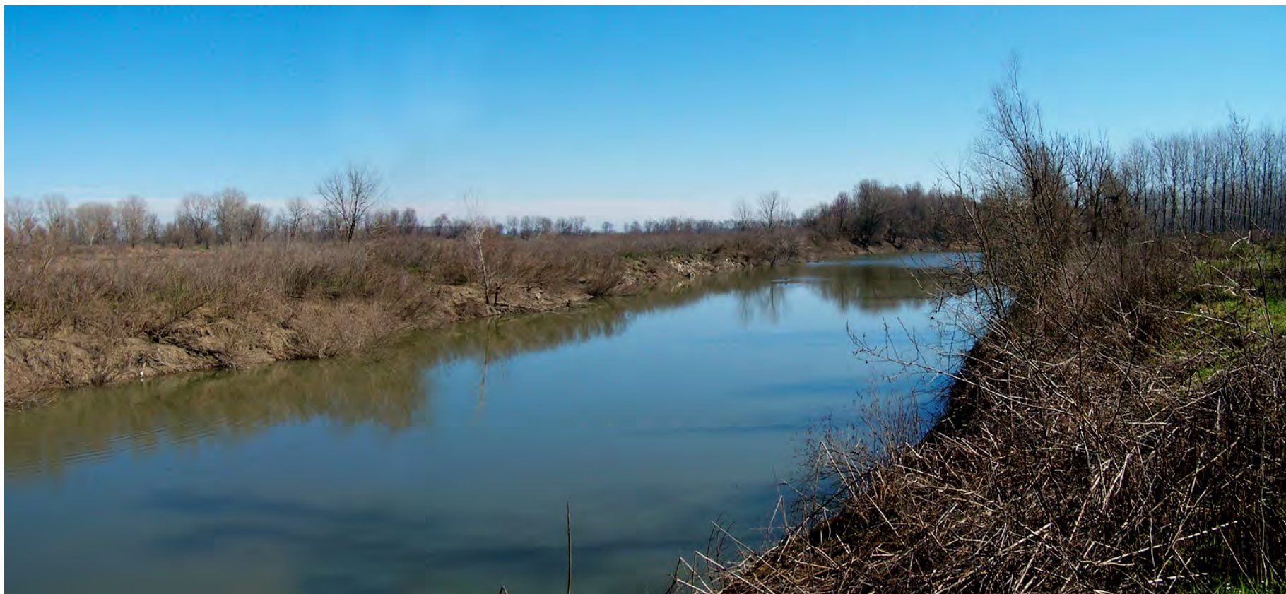
Ripresa n° 30 – il tratto iniziale della lanca del Pennello.