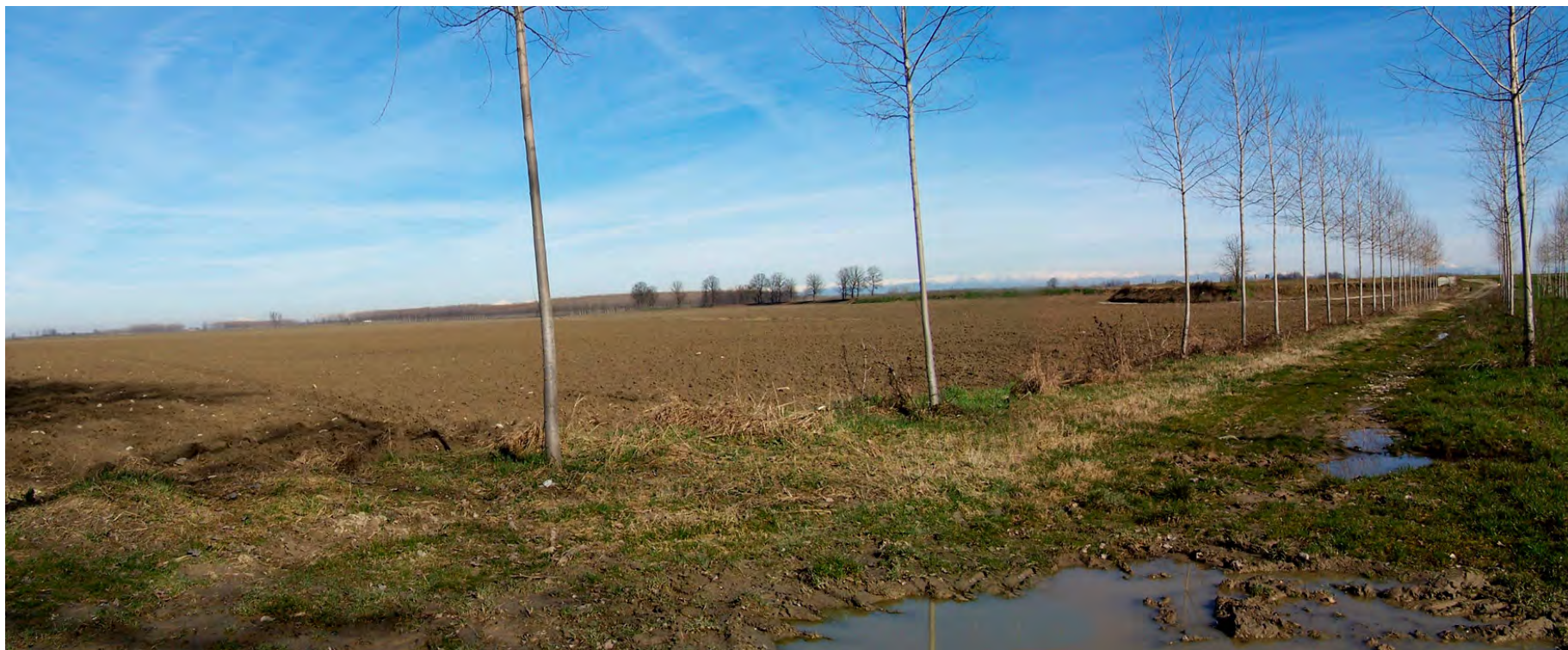
Ripresa n° 11 – La parte nord ovest della ZPS, completamente destinata a seminativi